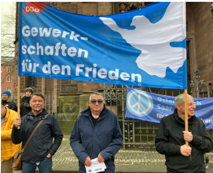
„Kriegsvorbereitung stoppen! Völkerrecht verteidigen!“ – unter diesem Motto hatte das Friedensnetz

Deutlich über 500 Demonstranten kamen am Karsamstag dieses Jahr zum Ostermarsch Saar nach Saarbrücken. Auch unser Ortsverein war mit fünf Transparenten und fünf Fahnen und 36 Kolleginnen und Kollegen gut vertreten.