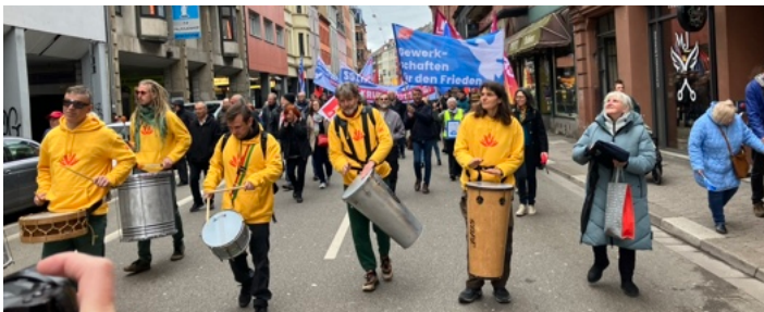
Saar zum traditionellen Ostermarsch aufgerufen. Die Veranstalter forderten unter anderem den Rückzug