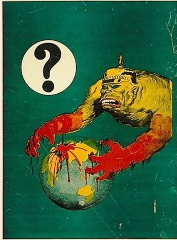
Britische Plakate WK I