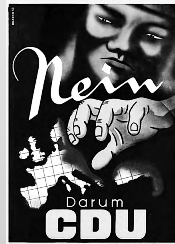
Mobilisierungspotential Antikommunismus. Die Botschaft ist eindeutig und keineswegs neu (CDU-Plakat zur Bundestagswahl 1949)