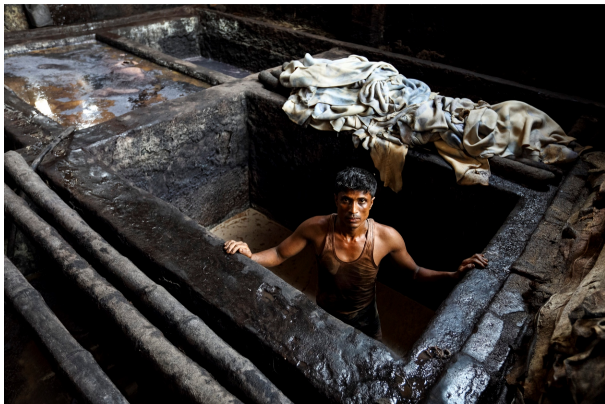
Arbeiter in einer Gerberei in Bangladesh