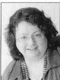
Monika Lührs umweltpolitische Sprecherin der SPD-Ratsfraktion Dortmund