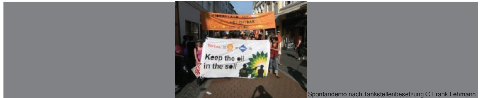
Spontandemo nach Tankstellenbesetzung