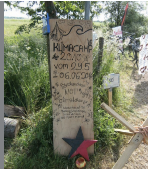
Eingang Klimacamp