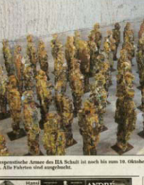
Die gepresste Annee des IIA Schult ist noch bis zum 10. Oktober im Salzstock von Gorleben zu sehen. Alle Fahrten sind abgebrochen.

Die 'Trash People' von HA Schult sind am Sonntag im Salzstock von Gorleben aufgetaucht. Die Kunstaktion ist eine spektakuläre Performance, bei der die Künstler aus Müll und Abfall Skulpturen geschaffen haben. Die Kunstaktion ist eine spektakuläre Performance, bei der die Künstler aus Müll und Abfall Skulpturen geschaffen haben.