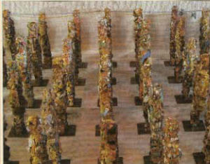
Stille Tage im Salz. Die 'Trash People' von HA Schult stehen im Salzstock von Gorleben.

Meuchwitz (dpa) Die Pro-Aktiven der Atomkraft, die die Errichtung eines neuen Atomkraftwerks in Meuchwitz fordern, werden am Sonntag in Meuchwitz eine Atomkonferenz abhalten. Die Konferenz wird von der Initiative 'Atomkraft ja' organisiert. Die Initiative fordert die Errichtung eines Atomkraftwerks in Meuchwitz. Die Konferenz wird von der Initiative 'Atomkraft ja' organisiert. Die Initiative fordert die Errichtung eines Atomkraftwerks in Meuchwitz. Die Konferenz wird von der Initiative 'Atomkraft ja' organisiert. Die Initiative fordert die Errichtung eines Atomkraftwerks in Meuchwitz.