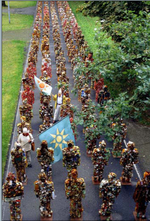
Trash People, Gedelitz 2004