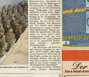
Die gepresste Annee des IIA Schult ist noch bis zum 10. Oktober im Salzstock von Gorleben zu sehen. Alle Fahrten sind abgebrochen.