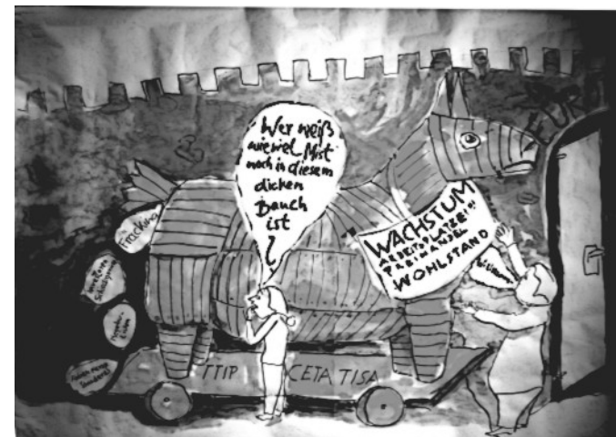
Attac-Bodentransparenz vom Aktionstag am 18.4. in Kassel

Beteiligen Sie Sich am 10. Oktober, an den Demonstrationen in Berlin, Frankfurt oder hier in Kassel!