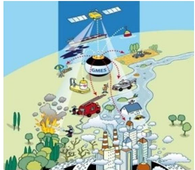
Dual Use-Projekte wie GMES können den Klimawandel ebenso beobachten wie „Terrorismus“

Wofür gibt das Militär Geld? Seit dem Jahr 2000 hat das US-Verteidigungsministerium nach Recherchen des NDR und der Süddeutschen Zeitung Projekte an mindestens 22 deutschen Hochschulen und Forschungsinstituten unterstützt. Darunter sind auch Universitäten, die sich eigentlich zu ausschließlich friedlicher Forschung verpflichtet haben. Insgesamt flossen seit 2000 mehr als 10 Mio. Dollar des US-Militärs in deutsche Forschung. Allein ein Max-Planck-Institut, die Fraunhofer-Gesellschaft, das Alfred-Wegener-Institut und ein Leibniz-Institut erhielten Mittel des Pentagon in Höhe von zusammen 1,1 Millionen Dollar. Das KIT hat seit 2003 fünf Pentagon-Aufträge im Gesamtwert von über 1 Million Euro erhalten. Nach Angaben der betreffenden Universitäten handelt es sich natürlich immer um reine Grundlagenforschung. Da sei mir der kurze Ausblick erlaubt, dass das ähnlich ist wie in der Kernfusion: diese Forschung wird auch im politischen Raum bis in die Reihen der SPD damit verteidigt, dass das ja Grundlagenforschung sei. Dabei hat man noch nie gehört, dass Kernfusion mit irgendetwas anderem begründet wird, als mit den Massen von Energie, die bei der Anwendung zu erwarten seien.