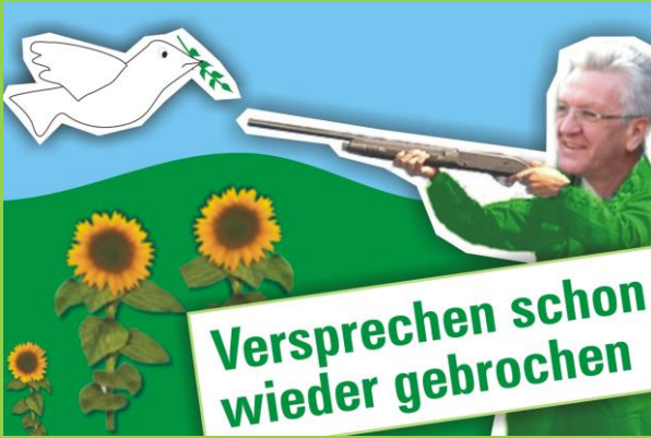
Versprechen schon wieder gebrochen! 09.05.2012 faktencheck-bw.de