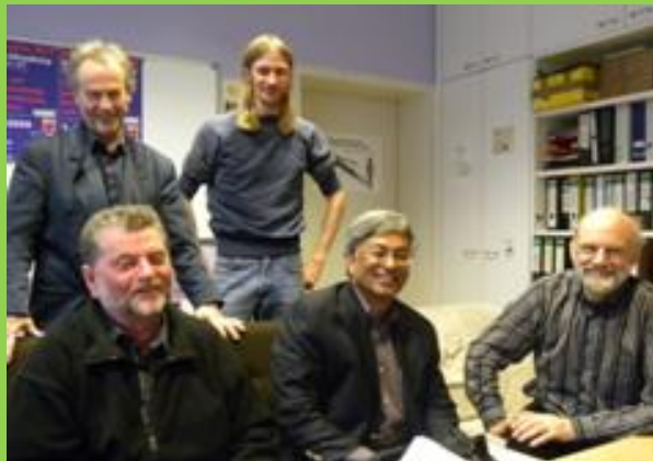
Erneute Diskussion über Rüstungsforschung am KIT 02.12.09 ka-news.de