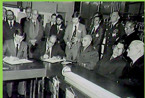
Sagt dem Bombendeal adieu! 19.11.14 Unterzeichnung deutsch-brasilianischer Vertrag 1978 im FZK. Quelle: Film „Bombenwahn“ 1989