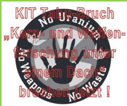
Tabu-Bruch brechen jetzt 08.04.2015 KIT im 6. Jahr „Kern- und Waffenforschung unter einem Dach“