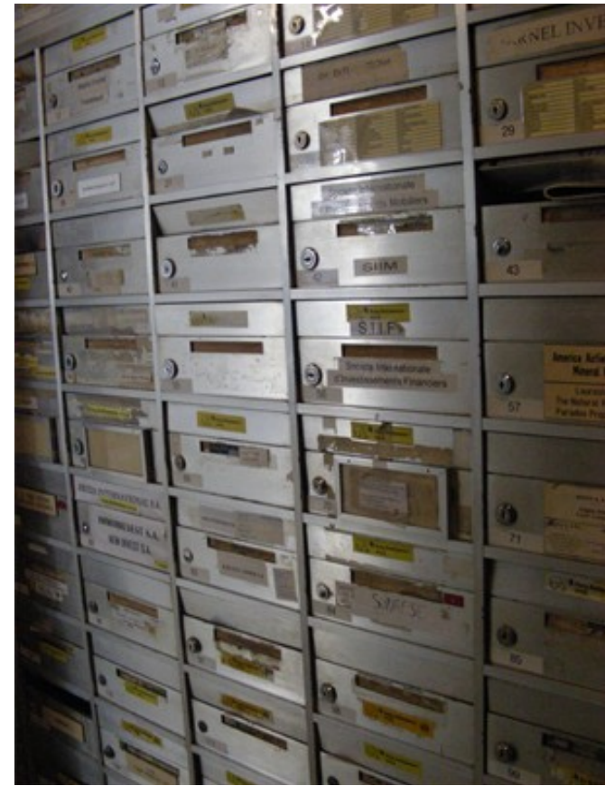
Fotos: Luxemburg, Boulevard Royal 21- 25. Sitz der Schweizer Botschaft, von 2 Ministerien und von Briefkastenfirmen.