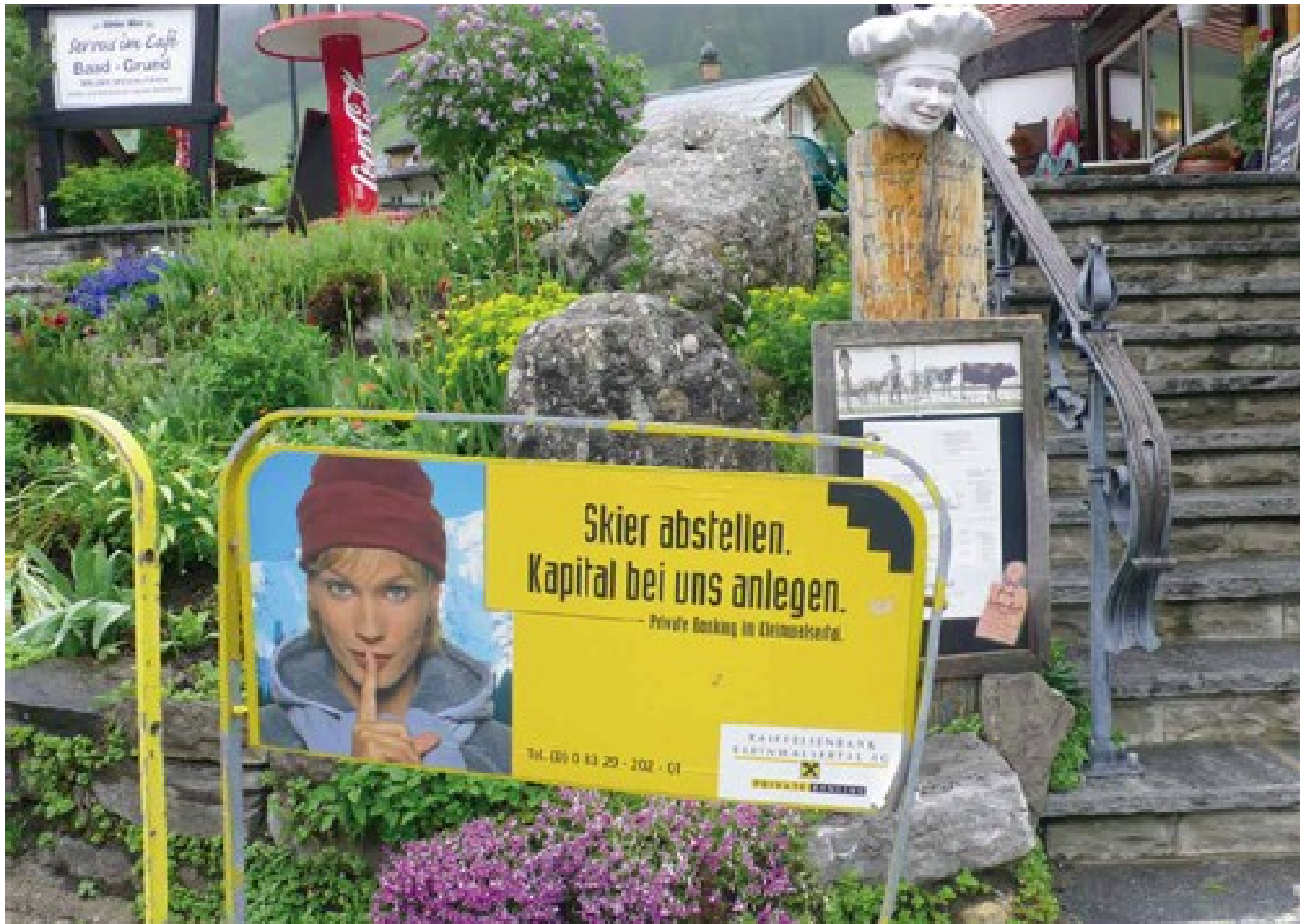
Foto: Ski-Ständer der Raiffeisenbank Kleinwalsertal in Riezerln (AT).