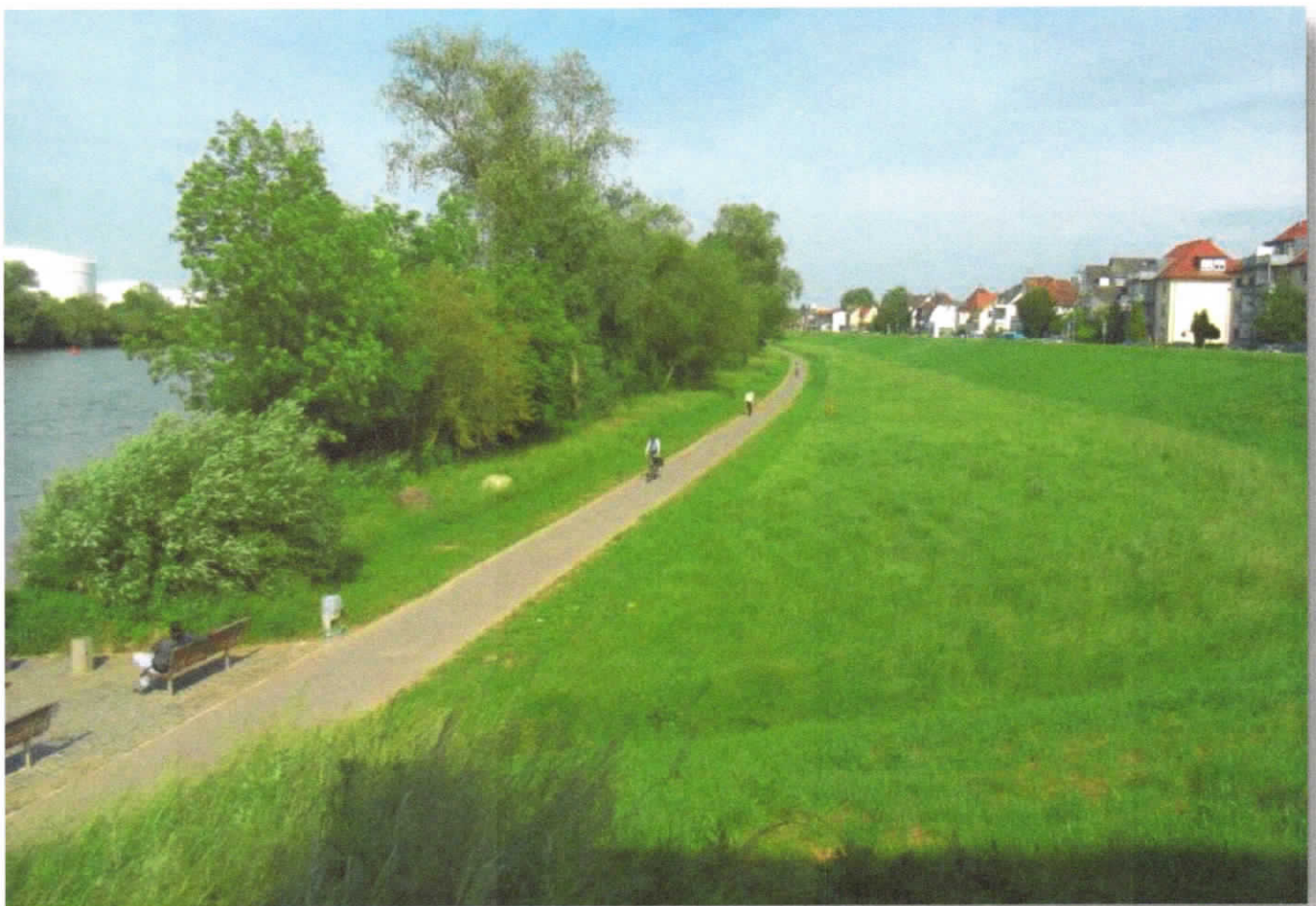
Mainwiesen Rüsselsheim am Main Mitte Mai 2018 vor dem Opelsteg