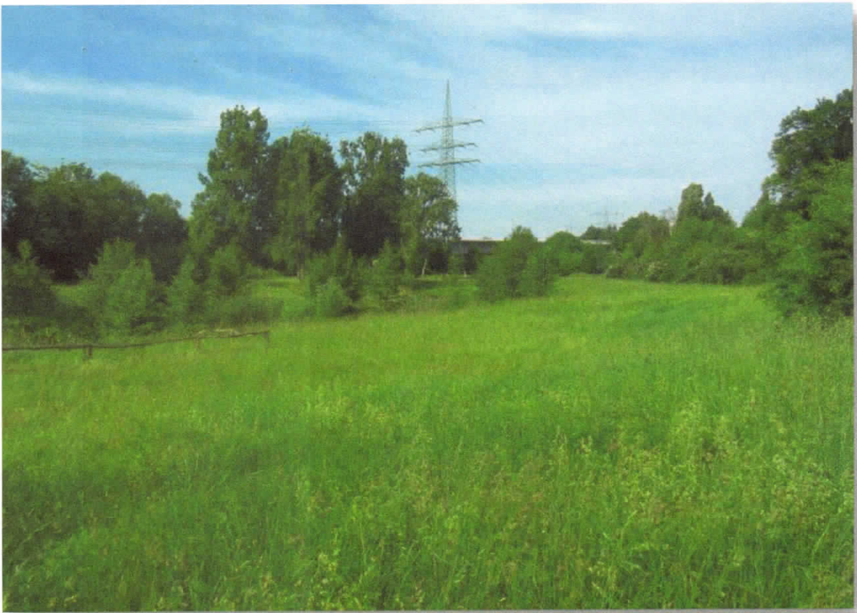
Mainwiesen Rüsselsheim Mitte Mai 2018 vor der Opelbrücke