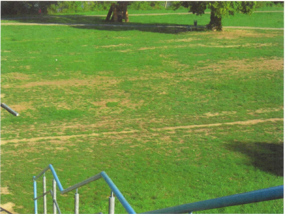
Offene Bodenflächen im Westteil