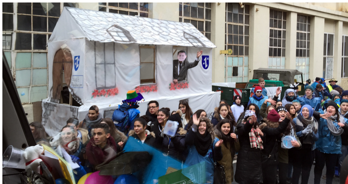
„Mer schmeißes Geld zum Fenster raus und mache e Karriere draus...“ Motivwagen der BI für den Erhalt der GHS beim Rüsselsheimer Gardetag