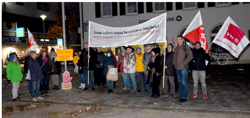
Mahnwache des Aktionsbündnisses für soziale Gerechtigkeit am 22. November 2022

Corona-Pandemie und Krieg bringen die Missstände der mangelnden Chancen- und Verteilungsgerechtigkeit wieder auf die politische Agenda. Ökologischer und sozialer Fortschritt bedingen sich gegenseitig und sind ohne Verteilungsgerechtigkeit nicht zu erreichen. Warum sollte es neben dem Mindestlohn nicht auch einen Höchstlohn geben? Warum werden Vermögenseinkommen geringer besteuert als Arbeitseinkommen und warum werden die Ausnahmeerlöse der Krisenprofiteure nicht radikal abgeschöpft? Die dringend gebotene sozial-ökologische Wende können wir erreichen: Ungebrochen solidarisch!