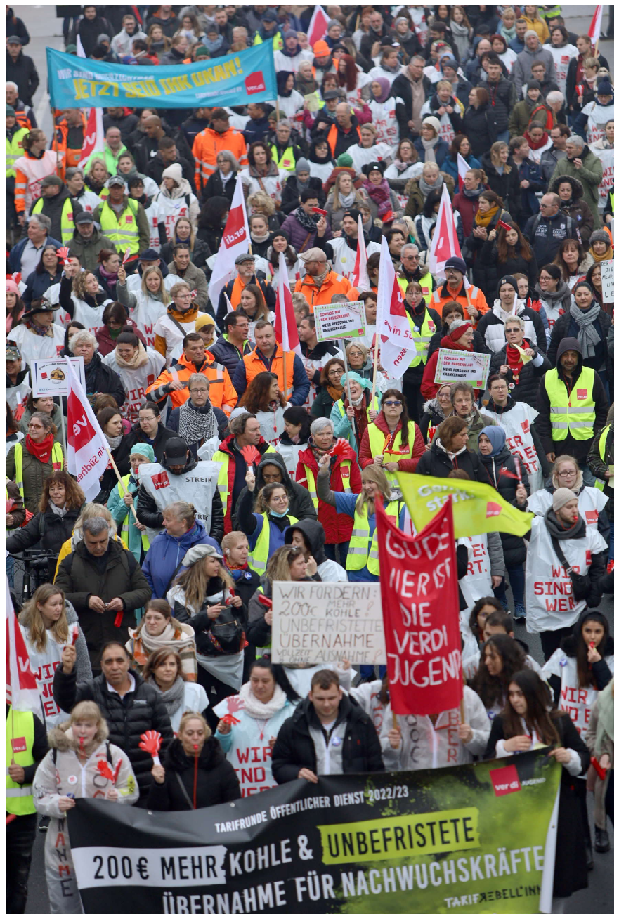
Streikundgebung am 23. Februar 2022 in Rüsselsheim

Die ver.di-Vertrauensleute bei der Stadt Rüsselsheim