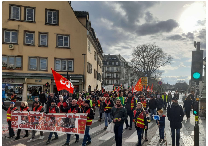
Demonstration gegen die Erhöhung des Renteneintrittsalters in Straßburg am 15. März 2023.

DGB Ortsverband Rüsselsheim, ver.di Vertrauensleute bei der Stadtverwaltung der Stadt Rüsselsheim, Katholische Arbeitnehmerbewegung, Katholische Betriebsseelsorge Rüsselsheim Südhessen, Ev. Dekanat Groß-Gerau/Rüsselsheim, Südhessisches Bündnis „Gemeinsam gegen Altersarmut von Frauen“, Arbeit und Leben Südhessen