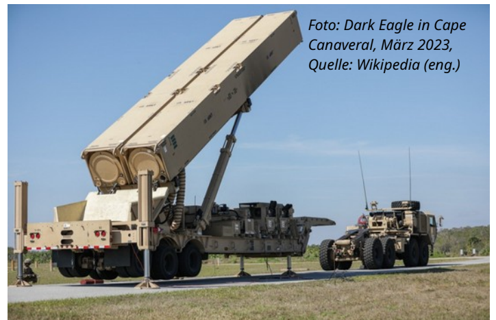
Foto: Dark Eagle in Cape Canaveral, März 2023, Quelle: Wikipedia (eng.)

Die dem Kommando untergeordnete 41. Feldartilleriebrigade im bayrischen Grafenwöhr stellt damals wie heute die Raketenkanoniere. Deshalb liegt es nahe, dass die „Dark Eagle“ in Grafenwöhr stationiert werden. Moskau liegt 2.000 km von Grafenwöhr entfernt.